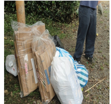
Recolección de material valorizable

El Ministerio de Salud es un aliado en este proceso, ya que en coordinación con sus funcionarios se realizan inspecciones para garantizar que los generadores que reciben este servicio estén realizando adecuadamente la separación. Con esto se hace cumplir el artículo N°38 de la Ley para la