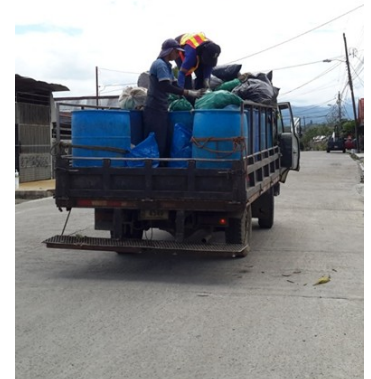
Recolección de residuos orgánicos