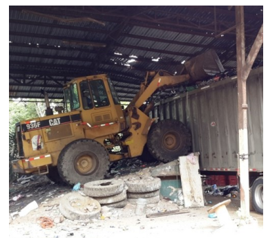
Centro de transferencia de residuos no valorizables